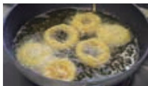
▲揚げ物がカラッと軽く揚げられます

が長持ちすることなどを説明し、国産米を原料とするこめ油を使って「カリー風味のオニオン☆リング」「シャキシャキ乾物とさらだ」を説明し、料理に使うと素材の味を引き立ておいしさを演出しています。