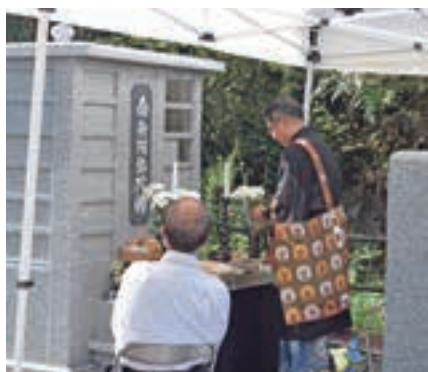
▲お盆の墓前法要を行ないました