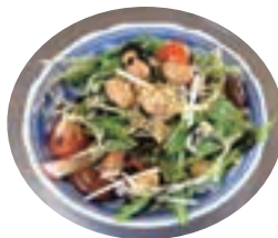
▲シャキシャキ乾物とさらだ

JAは9月20日、安芸郡海田町の専念寺せし王墓苑で、「合同墓墓前法要」を行ないました。参列されたみなさまは心を込めて手を合わせ、ご参拝されていました。墓苑は、JAが専念寺と契約し、管理、運営しています。合同墓は、少子高齢化や生活様式の多様化などで供養の形が変わりつつある時代のニーズに対応し、新しいスタイルの永代供養として建立しました。