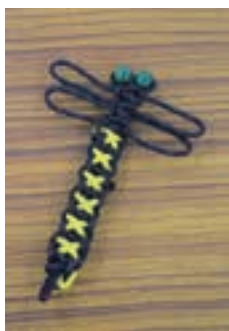
▲オニヤマのお守り

女性部上瀬野支部カトルアグループは9月23日、旧JA上瀬野支店で手芸教室を開き、家の光の記事を参考にして「オニヤ