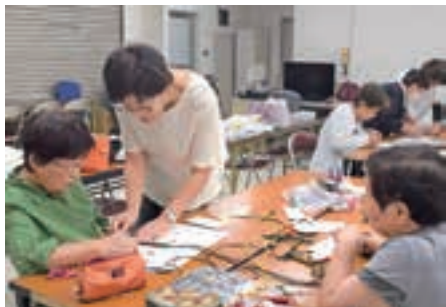
▲部員同士協力して完成しました

女性部上瀬野支部カトルアグループは9月23日、旧JA上瀬野支店で手芸教室を開き、家の光の記事を参考にして「オニヤ