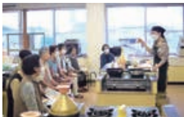
▲みなさん熱心に説明を聞かれていました